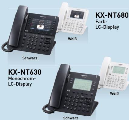
KX-NT680 Farb- LC-Display