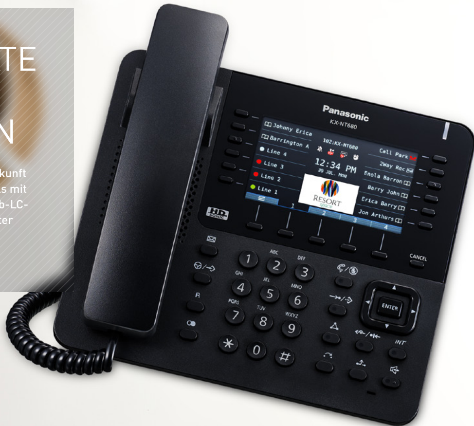
HD SONIC KX-NT680 Farb-LC-Display

Um der schnelllebigen Geschäftswelt auch in Zukunft gerecht zu werden, bietet Panasonic IP-Terminals mit modernster Technologie an. Das gut lesbare Farb-LC-Display mit integriertem HD-Audio und optimierter Bedienoberfläche erfüllt alle Anforderungen moderner User.